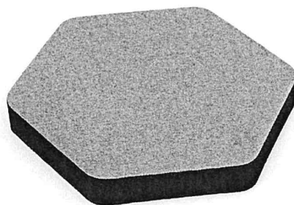
Dettaglio pannello Decho® Style – Versione poliestere col. nero

Sono escluse dalla fornitura eventuali pratiche relative alla sicurezza, relazioni, certificazioni, omologazioni relative ai pannelli assemblati e montati in opera o a singole parti di essi ed ogni altra documentazione tecnica o contrattuale non citata espressamente nel presente documento e non richiesta prima della emissione del Vs. ordinativo di acquisto.