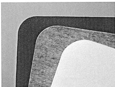
Pannelli Ecoplan nelle tre colorazioni standard

I materiali di base ed il processo produttivo consentono di ottenere un pannello di estrema leggerezza, con pesi prossimi ai 2 kg per metro quadro ( densità 45-50 Kg/mc ), risultando pertanto facilmente installabile sulle pareti e a soffitto con semplici operazioni di incollaggio o posa con velcro.