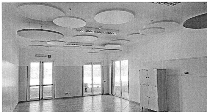
Pannelli Aural® in sospensione ed Ecoplan® in aderenza / sospensione